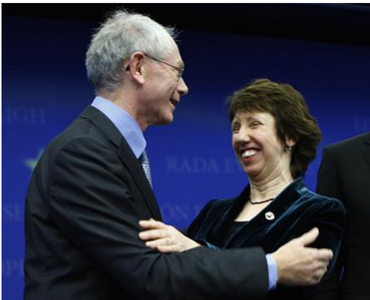
Herman Van Rompuy , presidente permanente del Consiglio Europeo, con Catherine Ashton , alto rappresentante dell'UE per gli Affari Esteri

Il trattato di Lisbona modifica i trattati di Roma e di Maastricht, conferendo all'Unione europea un nuovo quadro giuridico e gli strumenti necessari per far fronte alle sfide in un mondo sempre più interdipendente.